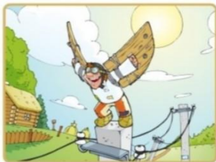
Не лезь на опоры и столбы

Чтобы не подвергать себя риску, запомните простые правила: