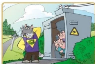
Не лезь на электроустановки и в трансформаторные будки

Опасно для жизни влезать на опоры линий электропередачи, проникать в трансформаторные подстанции или подвалы, где находятся электрические провода