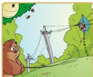
Не бросай ничего на провода и не играй вблизи

Никогда не заходите на территорию и в помещения электросетевых сооружений. Не открывайте двери ограждения электроустановок и не проникайте за ограждения и барьеры. Это может привести к печальным последствиям