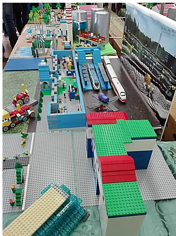
Свердловские железные дороги